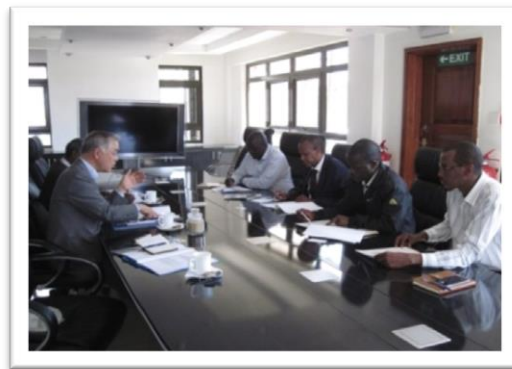
ケニア、通信建設業者との意見交換