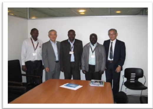
ケニア、通信事業者との意見交換