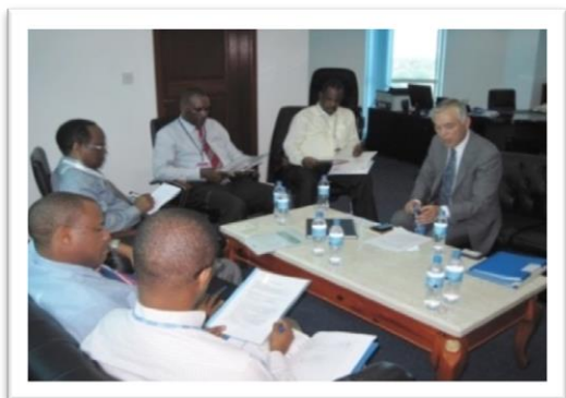
タンザニア、政府機関との意見交換